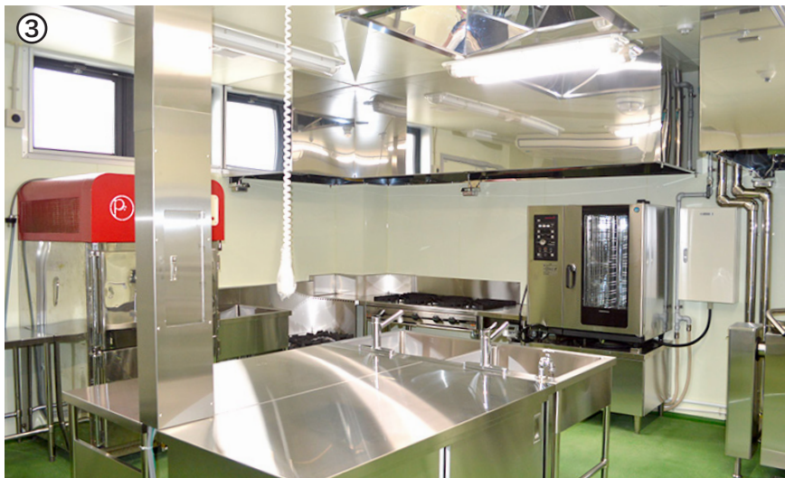
①外観は隣接するカフェ同様、下はブルー、上は白色 ②1階の床は食材を取り扱う衛生エリア（緑色）、非衛生エリア（黄色）と用途に合わせて色分けされています ③お店で提供される料理がこちらで作られます